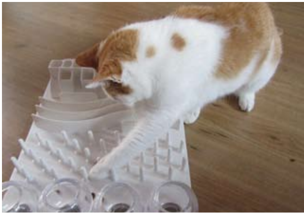
Een kat laten werken voor eten, houdt hem mentaal gezond.

oorzaken pijn, met name tandvleesproblemen of chronische maag-darmproblemen, zoals verstopping. Evolutie-nair gezien is het niet verstandig om als kat te laten merken dat je pijn hebt, dit met het oog op grotere roofdieren. Hierdoor is het vaak lastig vast te stellen dat een kat pijn heeft. Toch laat een kat met pijn vaak wel gedragsveranderingen zien; hij gaat klagen of blazen bij aanraking, of bij het urineren of ontlasten. De kat gaat vaak naar de kattenbak, wordt minder sociaal of actief, en springt niet meer op favoriete plekken. Ook kan hij door bijvoorbeeld tandvleesproblemen een verminderde eetlust krijgen.